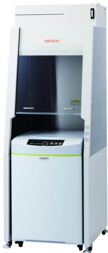
安全キャビネット：BHC-660IFS II（クラス I） 遠心機：S700FR