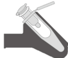
スピнкаラム用 アダプタ未装着時