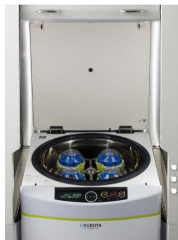
LED照明点灯時のチャンバ内 遠心機：S700FR