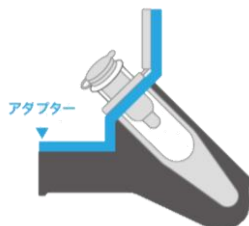
スピнкаラム用 アダプタ装着時