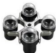
ST-2504MS シーリングキャップ