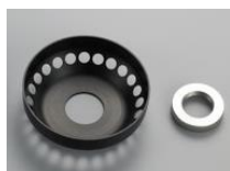
スピнкаラム用アダプタ