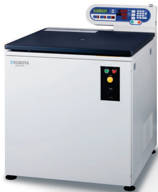
大容量冷却遠心機