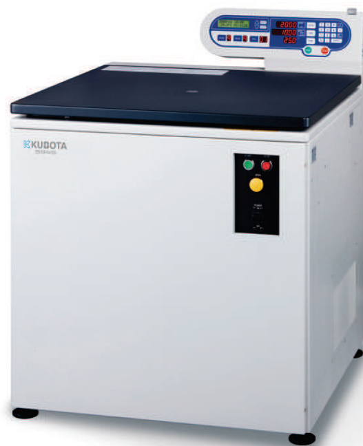
大容量冷却遠心機