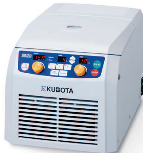
マイクロ冷却遠心機