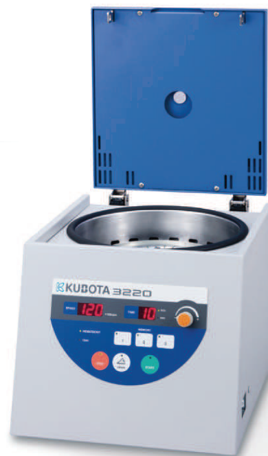
ヘマトクリット遠心機