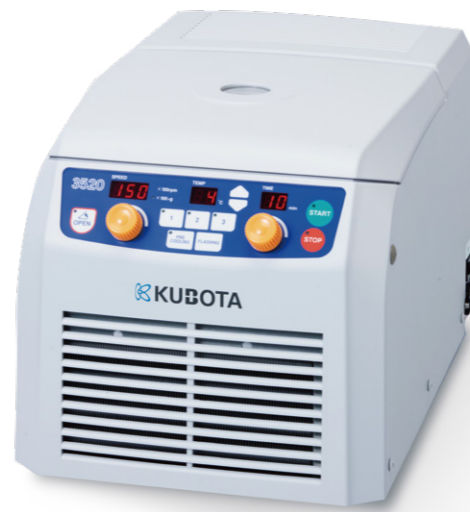
マイクロ冷却遠心機 3520 IEC 61010-2-020 国際安全規格準拠